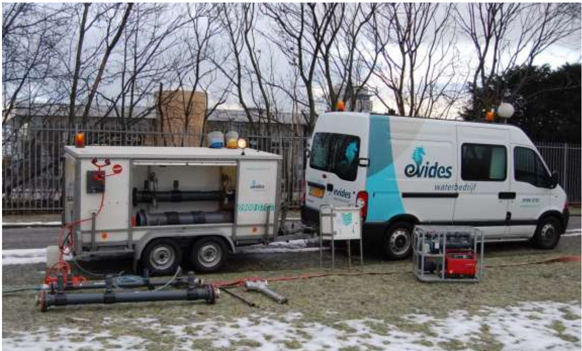
Figuur 2 Overzicht van mogelijke hulpapparatuur voor desinfectie van het leidingnet.

Er zijn toestellen ontwikkeld voor het desinfecteren en spuien van leidingen (zie Figuur 2). Hiermee wordt het desinfectiemiddel van te voren met drinkwater gemengd en vervolgens in de leiding gebracht. Toestellen als dit worden tevens gebruikt voor het neutraliseren van het desinfectiemiddel in het spuiwater.