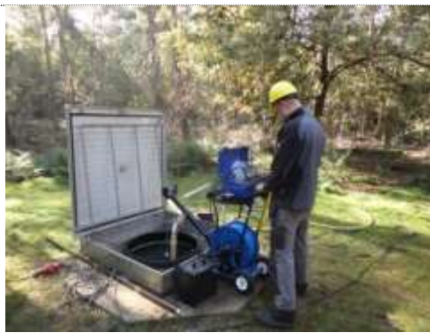
Foto 30. Camera inspectie