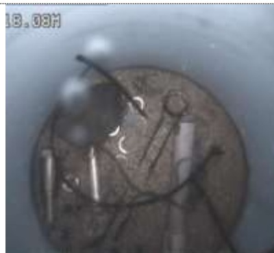
Foto 28. Gereedschap dat in de zandvang is gevallen tijdens werkzaamheden