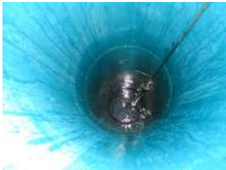
Foto 21. Flowsnelheidsmeter boven waterspiegel