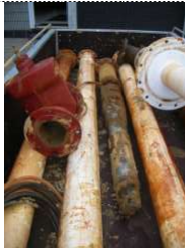
Foto 2. Defecte onderwaterpomp en pomppersbuizen, volledig bedekt met ijzerslib en slijk