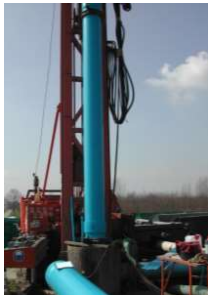
Foto 18. Inbouw PVC pompkamer