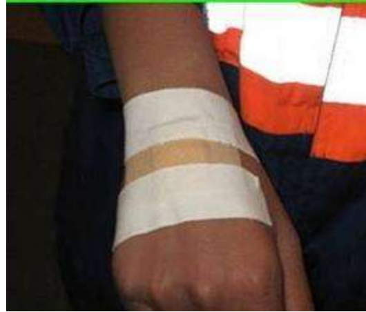
Foto 12. Zorg voor een stevige afdekking op wondjes aan de handen