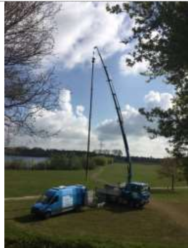
Foto 24. Pomp trekken en laten hangen tijdens werkzaamheden zodat deze schoon blijft