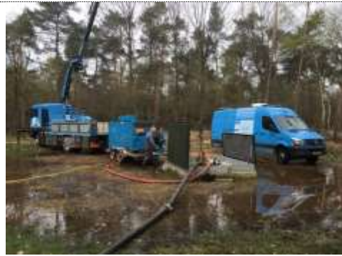
Foto 23. Regeneratiewerkzaamheden