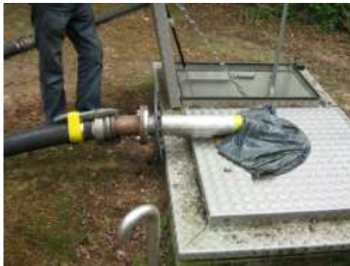
Foto 25. Afdekking tijdens regeneratiewerkzaamheden