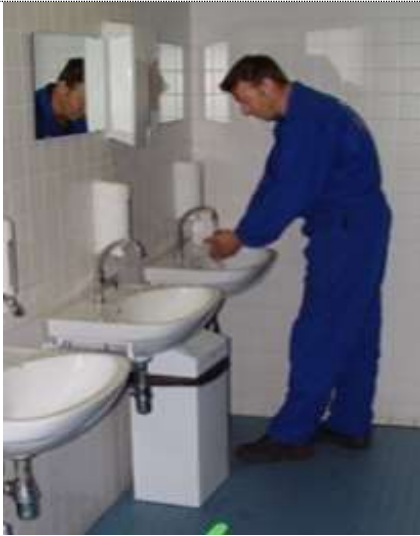
Foto 11. Handen wassen is een belangrijk onderdeel van hygiënisch werken