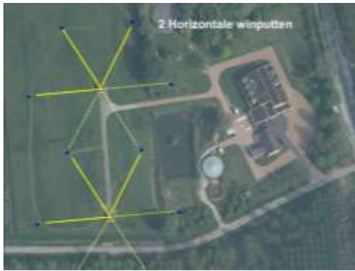
Foto 7. Boven aanzicht winveld Druuten met in blauw de waarnemingsfilters gesitueerd achter de horizontale strang (figuur Vitens)