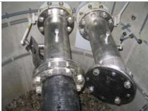
Foto 27. Harde onderbreking van ruwwaterleiding met een spuiwaterleiding