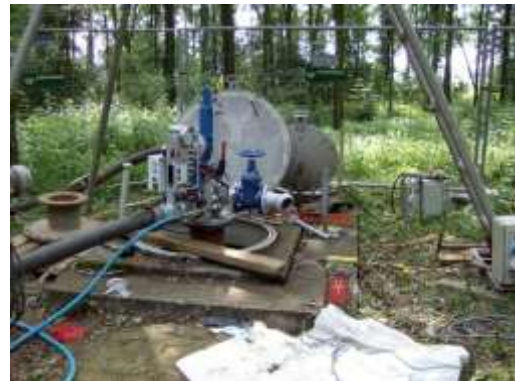
Foto 26. Regeneratiewerkzaamheden